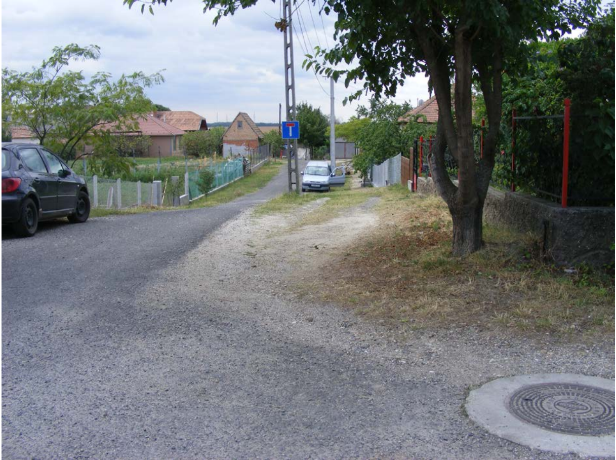
Dunavarsány, Ifjúság u.